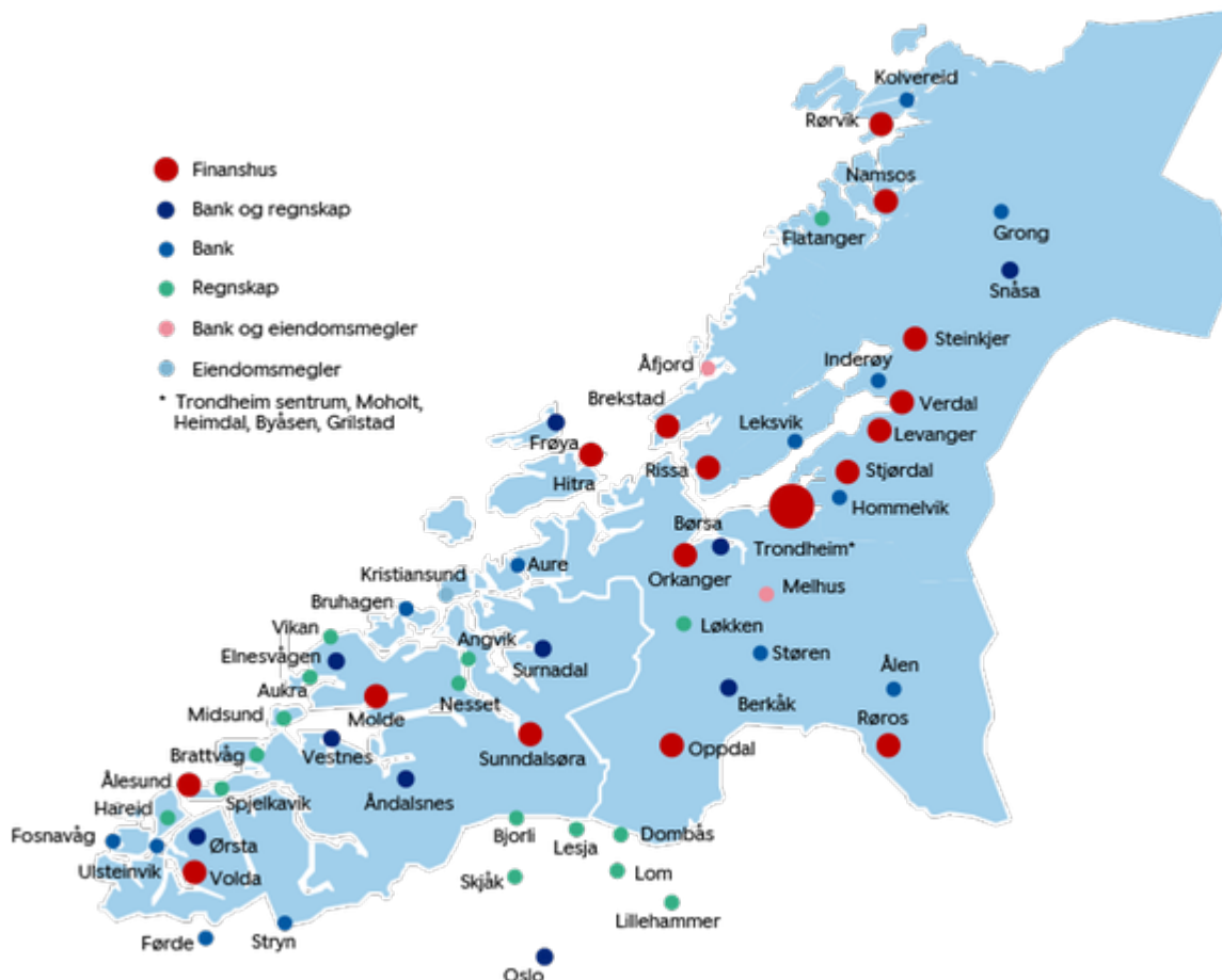
Figur 2: Oversikt over SpareBank 1 SMN-konsernets kontorer